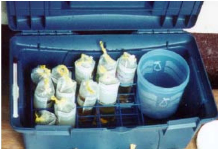
Figura 1; Aparato del método para detectar bacterias productoras de H 2 S.

Modificamos el método de Manja et al utilizando las bolsas plásticas estériles "Whirlpak" de 118 ml (Nasco, Fort Atkinson, WI; Cat# B1062) en vez de las botellas estériles. Todo el aparato se contiene en una caja de plástico de aproximadamente 40 x 20 x 20 centímetros (vea Figura 1). Hay un portabolsas que puede aceptar hasta 15 bolsas Whirlpak, un termómetro, y contenedores para algodón, alcohol y las cápsulas del medio de cultivo. Ocupamos el medio de cultivo "Pathoscreen P/A" (Hach Co., Loveland, CO, Cat.# 26106-96 ).